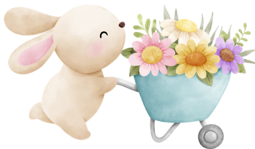
Illustration & Idee: Lisa Kregar