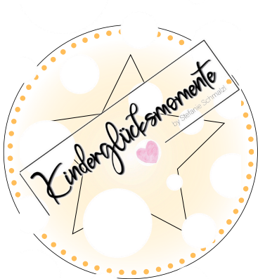
Illustration & Idee: Lisa Kregar